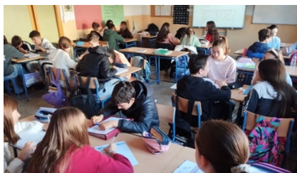
Equipos cooperativos de 1º ESO