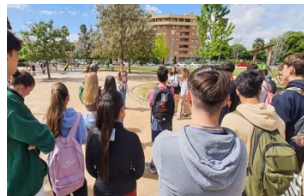
Plaza Fernández Castro