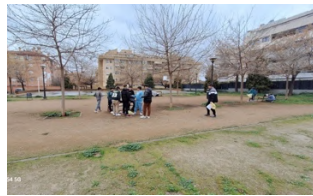
Parque República de Ecuador