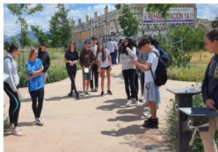
Casería de los Cipreses.