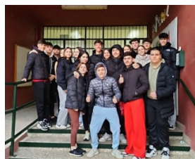
CEIP San Juan de Dios