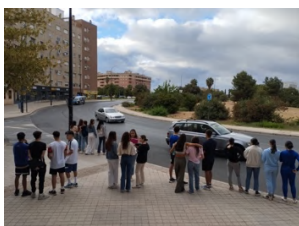
Estudio del tráfico