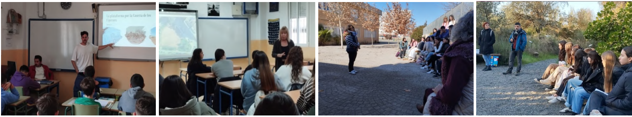
Plat. Casería de los Cipreses Asociación Albayda. Happy Cat Spain Rescue Acción en Red

Algunas entrevistas se han producido en el Instituto donde hemos recibido a miembros de la Plataforma por la Casería de los Cipreses, una representante de Happy Cat Spain Rescue, un botánico investigador de la Estación Experimental del Zaidín (CSIC), responsables de Acción en Red y una vocal de la Asociación de Vecinos/as Albayda.