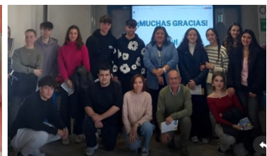
Sede de Granada Down