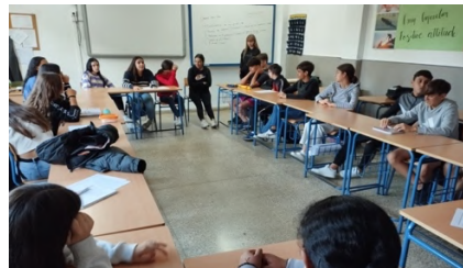
Asamblea de 3º ESO