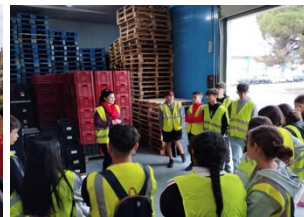
Banco de Alimentos.