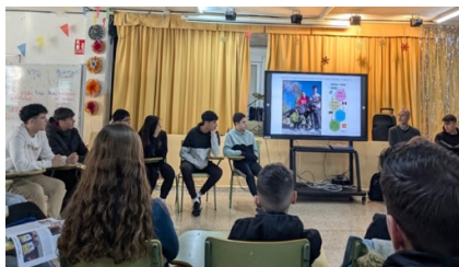
Reunión del Comité Ecosocial.

Lo ideal es la democracia participativa que se vive en el aula donde cada persona puede expresarse. Así se hizo al dialogar en asamblea sobre el proyecto del barrio, al investigar con los compañeros y compañeras en equipos cooperativos, al decidir sobre la acción-servicio a llevar a cabo, al escribir colectivamente un resumen para compartir con las demás clases, al evaluar el trabajo y al celebrarlo.