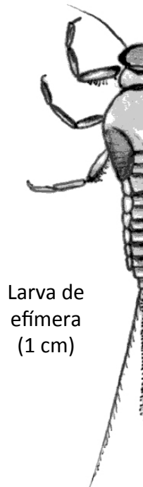
Larva de efímera (1 cm)