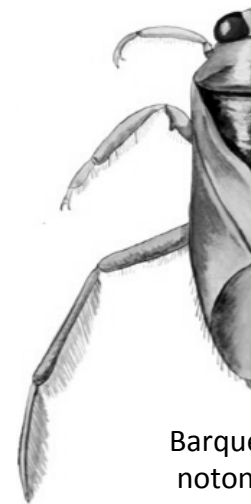
Barquero acuático o notonecta (1,5 cm)