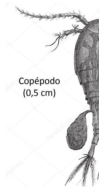
Copépodo (0,5 cm)